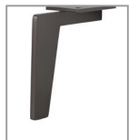
Metallfuß, versch. Metallfarben