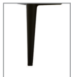
Metallfuß, versch. Metallfarben