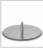
Drehteller Chrom glänzend für Sessel MD F PG