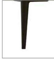
Metallfuß, versch. Metallfarben F S1