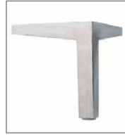
Gussmetallfuss glänzend F 70