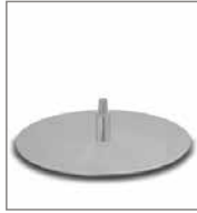
Drehteller Chrom matt Optik für Sessel MD F PM